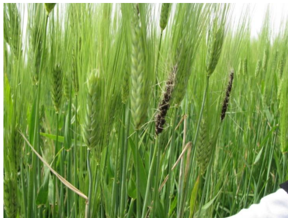
شکل ۳- علائم بیماری سیاهک آشکار و لکه نواری جو