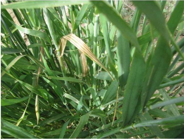
شکل ۲- علائم بیماری لکه نواری جو