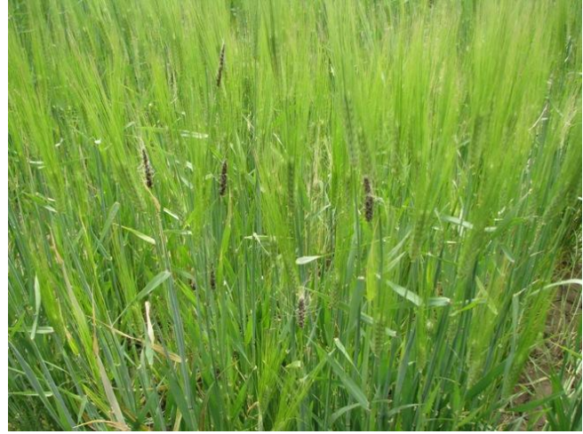
شکل ۱- علائم بیماری سیاهک آشکار جو